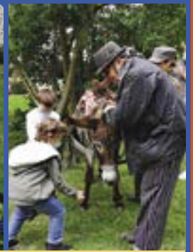
Chocolat, l'âne philosophe est venu à Presles avec les Souffleurs commandos poétiques (Communauté de Communes du Val Briard).