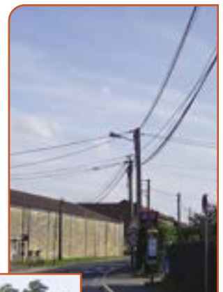
En fin d'année, 2 ème tranche d'enfouissement des réseaux, hameau d'Authueil.