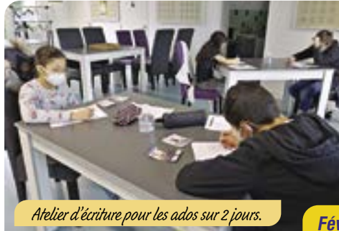
Atelier d'écriture pour les ados sur 2 jours.