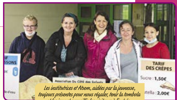
Les institutrices et Atsem, aidées par la jeunesse, toujours présentes pour nous régaler, tenir la tombola et les jeux et accueillir les visiteurs à l'entrée.

Si nous n'avons pu faire de la restauration sur place et le traditionnel lâcher de ballons, les stands de jeux, crêpes et boissons ont bien repris leurs places dans la cour de l'école maternelle, sans oublier la tombola : un réel succès avec plus de 400 lots achetés dont une