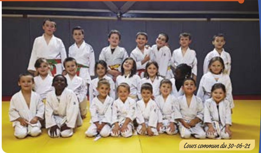
Cours commun du 30-06-21

2 entraînements «découverte judo ou taïso» seront offerts afin de faire découvrir nos disciplines aux petits et grands.