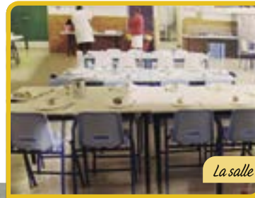
La salle avant