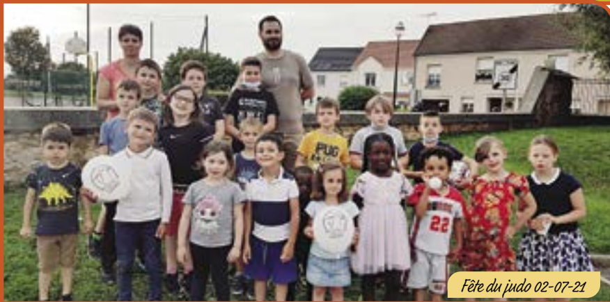
Fête du judo 02-07-21

Pour tous renseignements : judoclubdepresles@free.fr et la page facebook Judo club Presles-en-Brie