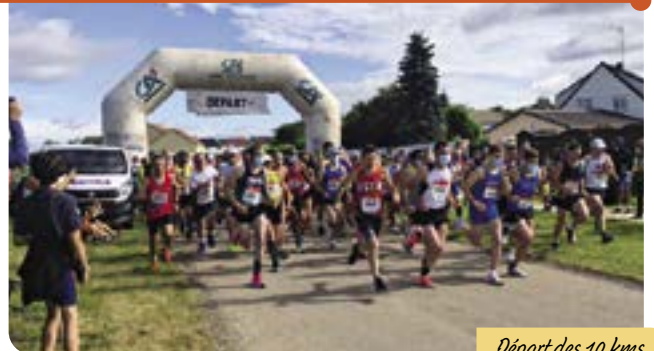
Départ des 10 kms