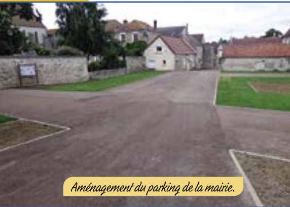
Aménagement du parking de la mairie.