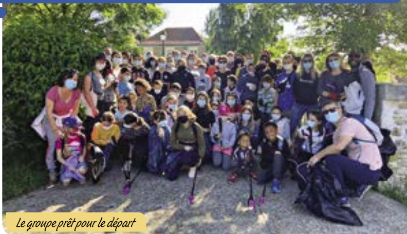
Le groupe prêt pour le départ