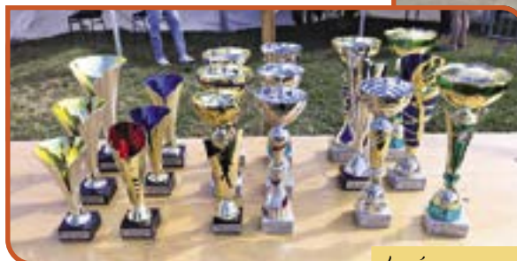
Les récompenses pour les vainqueurs