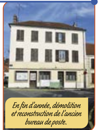
En fin d'année, démolition et reconstruction de l'ancien bureau de poste.