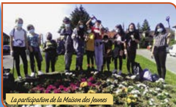
La participation de la Maison des Jeunes