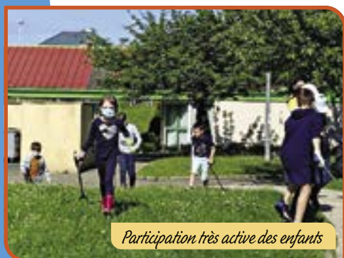
Participation très active des enfants