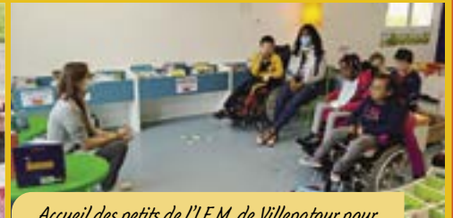
Accueil des petits de l'I.E.M. de Villepatour pour des lectures et une visite de la médiathèque.