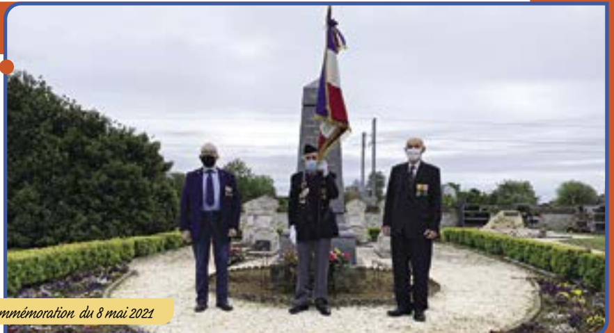
Commémoration du 8 mai 2021

En considérant les restrictions sanitaires en vigueur, la commémoration du 8 mai a été respectée, l'hommage a été rendu, en présence des membres de la FNACA et d'élus du conseil municipal, recueillement et dépôt de gerbes au monument aux morts.