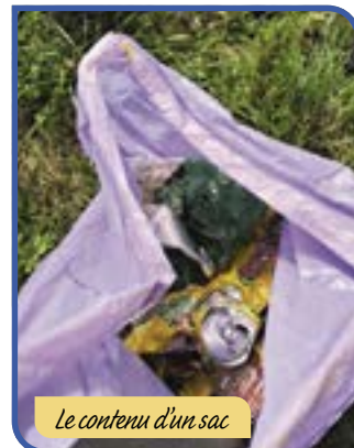
Le contenu d'un sac