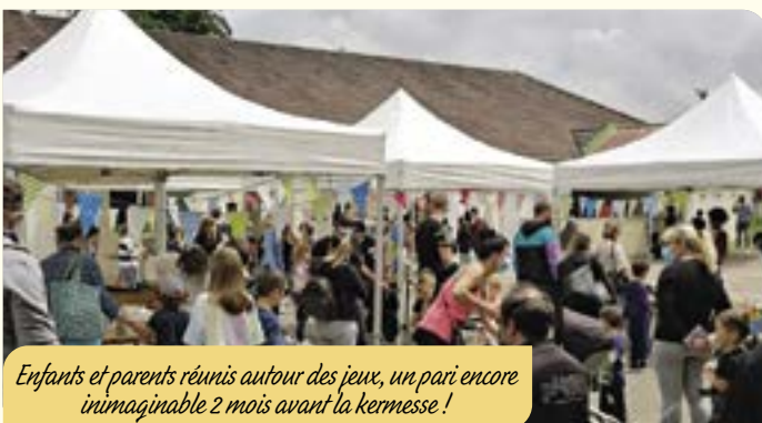
Enfants et parents réunis autour des jeux, un pari encore inimaginable 2 mois avant la kermesse !