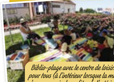
Biblio-plage avec le centre de loisirs et pour tous (à l'intérieur lorsque la météo n'a pas permis de profiter de l'extérieur).