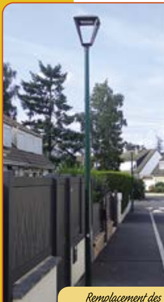
Remplacement des lampadaires du lotissement de la Marsange sur 3 années (2021-2022 et 2023).