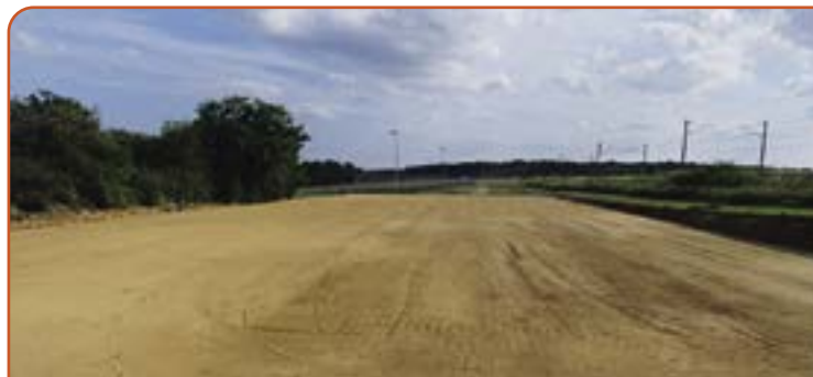
Démarrage des travaux du futur gymnase/salle polyvalente : création de la plateforme.