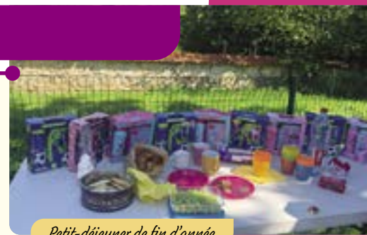
Petit-déjeuner de fin d'année

Nous vous donnons rendez-vous au forum des associations pour de nouvelles inscriptions. Prenez soin de vous.