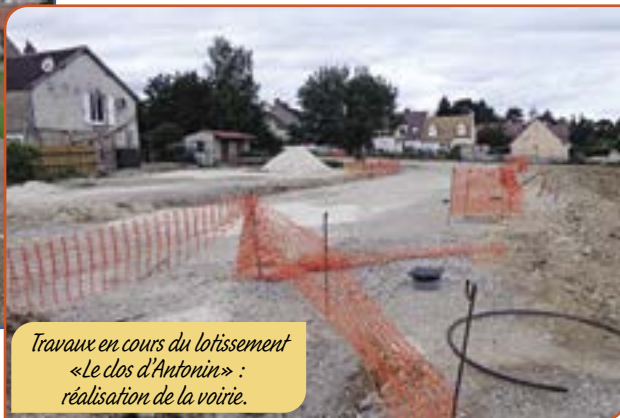
Travaux en cours du lotissement «Le dos d'Antonin» : réalisation de la voirie.