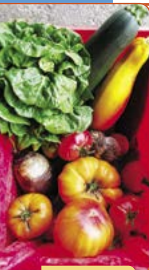
Contenu des paniers