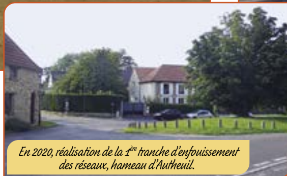
En 2020, réalisation de la 1 ère tranche d'enfouissement des réseaux, hameau d'Authueil.