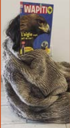
1 er Prix : Lina