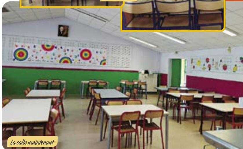
La salle maintenant