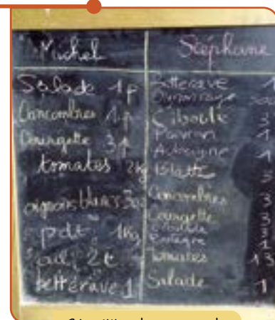
Répartition des commandes