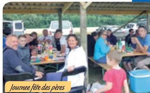
Journée fête des pères