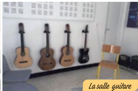
La salle guitare