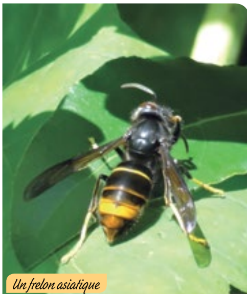
Un frelon asiatique