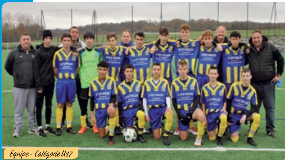
Equipe - Catégorie U17