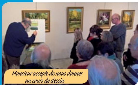
Monsieur accepte de nous donner un cours de dessin.