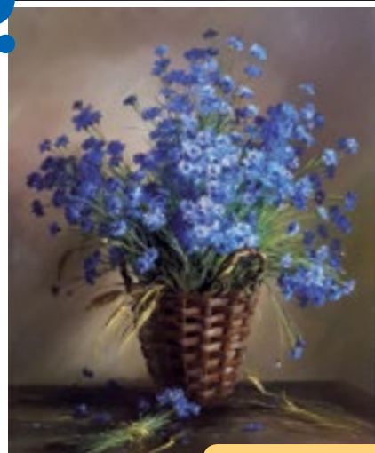
Expo Toutounov 2018

Nous vous en reparlerons en temps utile. Nous avons eu la chance de pouvoir, malgré tout, vous proposer en ce mois de décembre une belle manifestation artistique. Sergei Toutounov peintre de renommée internationale, a su pour la troisième fois à Presles, ravir les yeux des visiteurs avec ses bouquets de fleurs plus vrais que nature et ses lumineux paysages. Nous vous souhaitons une belle nouvelle année.