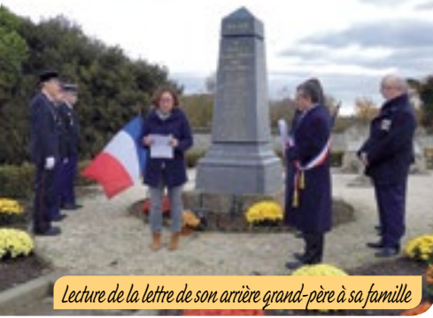
Lecture de la lettre de son arrière-grand-père à sa famille

Chaque année, les cérémonies rappellent la fin d'un cruel conflit qui fit plus d'un million de morts et six fois plus de blessés parmi les troupes françaises. Depuis 2012, le 11 novembre, jour anniversaire de l'Armistice de 1918 et de la commémoration annuelle de la victoire