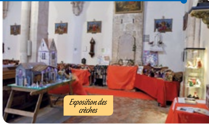
Exposition des crèches

Une vidéo a été réalisée par Michel Campenon, vous pouvez la visualiser sur YouTube en tapant «crèches de Noël 2018 à Presles-en-Brie».