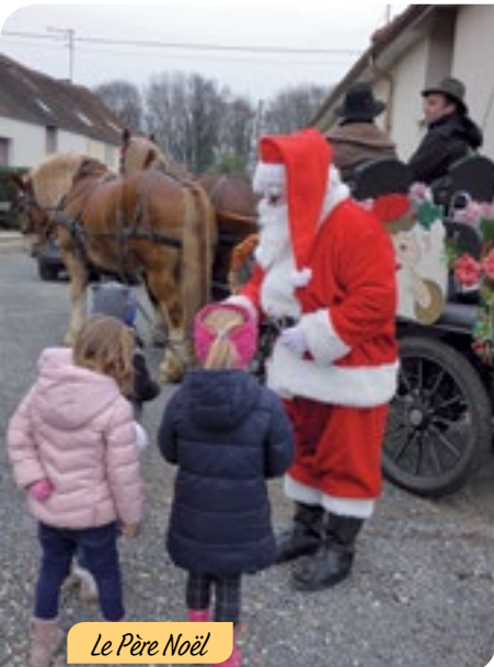
Le Père Noël

Puis des familles sont arrivées petit à petit, avec à leur tête les enfants fins prêts pour LE GRAND MOMENT de la journée, la photo avec le père Noël tout juste revenu de sa grande tournée dans les rues de notre village, à bord d'un magnifique attelage.