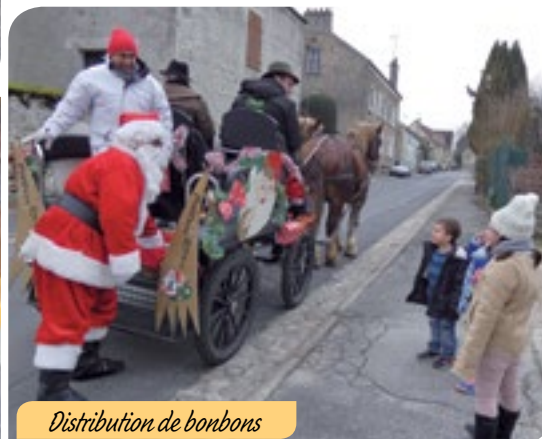
Distribution de bonbons