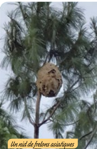
Un nid de frelons asiatiques