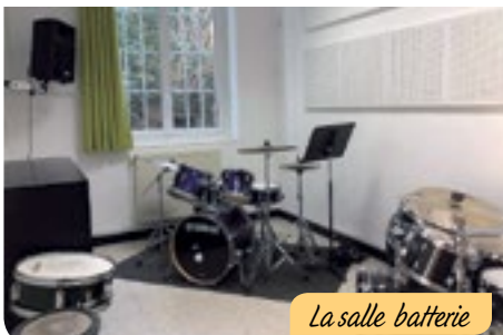
La salle batterie