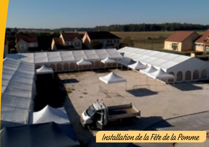
Installation de la Fête de la Pomme