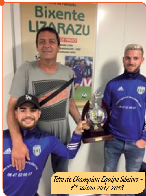
Titre de Champion Equipe Séniors - 1 ère saison 2017-2018