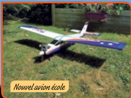
Nouvel avion école