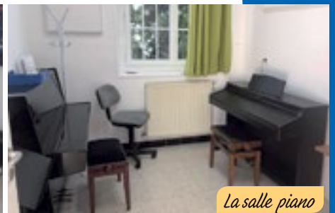
La salle piano