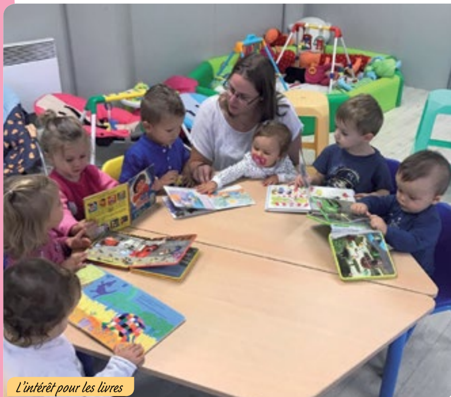
L'intérêt pour les livres