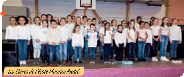
Les Elèves de l'école Maurice André

La médaille de reconnaissance de la commune a été remise à des jeunes championnes presloises :