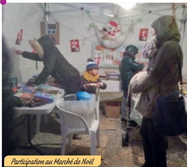
Participation au Marché de Noël