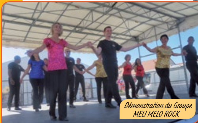
Démonstration du Groupe MELI MELO ROCK