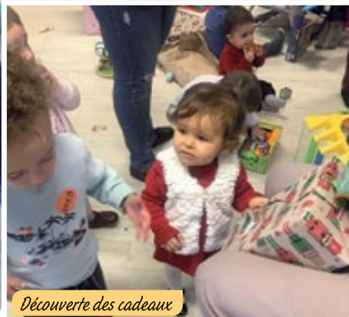
Découverte des cadeaux